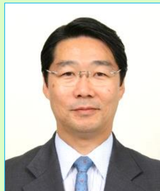
前川喜平 (元文部科学省事務次官)

元文部科学事務次官と本研究会会長の対談が実現。障がいを持つ青年たちの新時代にふさわしい青年期教育や専攻科のあり方、また今後の展望などを余すところなく語っていただきます。