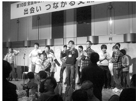
▲第10回福岡大会 交流会

●障がいのある青年は、18歳で特別支援学校を卒業すると、一般就労（企業など）が福祉的就労（作業所など）の違いはあれ、ほとんどが社会へ出るしか道がありません。しかし、障がいがあるからこそ、ゆっくり時間をかけて学び、様々な体験を積み、人生を豊かに生きるための土台を作ることも大事です。そうした願いをかなえるのが 専攻科 で、福祉の場でかなえたのが「 学びの作業所 」です。この「 学びの作業所 」が、今全国に広がっています。