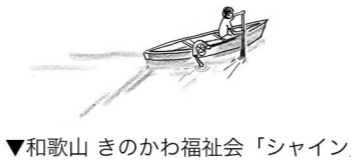
▼和歌山 きのかわ福祉会「シャイン」