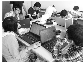
▲和歌山 きのかわ福祉会「シャイン」