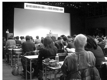
▲第10回福岡大会 全体会